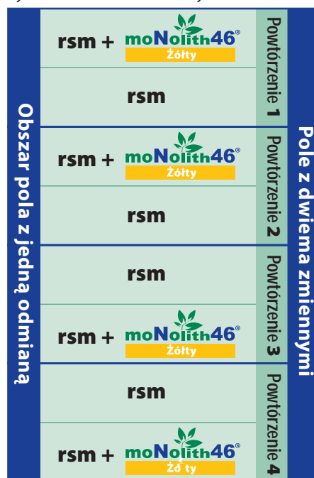
Rys. 1. Pole z dwiema zmiennymi

Wyniki doświadczeń przeprowadzonych w gospodarstwie na różnych polach i w różnych latach poprawią zrozumienie jak aktualne działania agrotechniczne, produkty, pogoda i zmienność gleby wpływa na wysokość plonu i zyskowność uprawy.